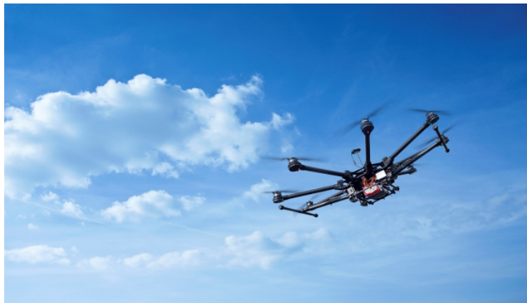
1. Naast technische innovatie is sociale innovatie en communicatie met de omgeving nodig.

De AWP komt op voor mensen die voor slimme, mooie, verstandige en pragmatische oplossingen gaan, in waterveiligheid, waterbeheer, waternatuur en waterzuivering. We staan maatschappelijk gezien voor grote uitdagingen. Water is de blauwe draad in klimaatadaptatie, circulaire economie en energietransitie.