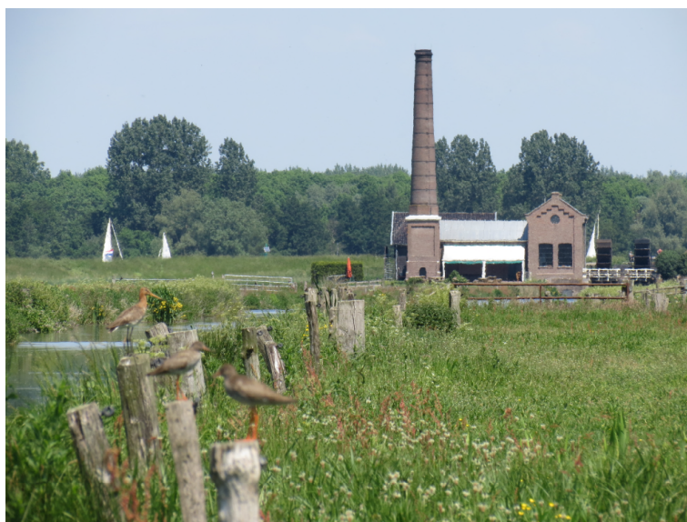
4. Leer van het verleden, leef in het heden, bereid je voor op de toekomst.

Behoud van waterhistorie betekent voor de AWP niet dat alle kosten per se ten laste van het waterschap komen. Samenwerking in het beheer kan ook commerciële exploitatie of zelfs overdracht van eigendom betekenen. Open oog voor kansen en ruimte voor maatwerk maakt veel mogelijk.