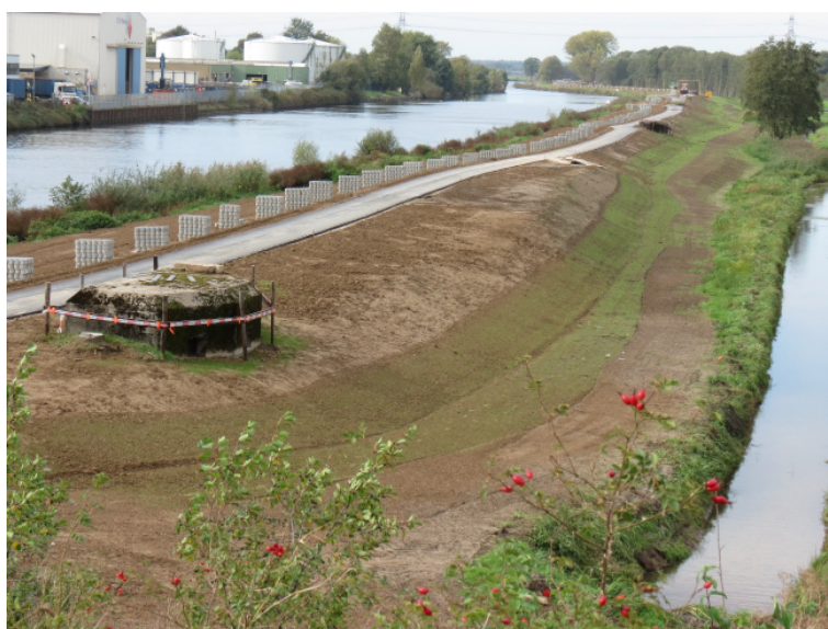
8. Overstromingen tegen gaan met betrouwbare waterkeringen en voldoende ruimte voor de rivier is het grootste belang.

De dijken moeten zo verstandig en snel als maar mogelijk is aan de eisen voldoen, en vooral ook blijven voldoen. Met de stijgende zeespiegel en perioden met meer hoosbuien in het verschiet is dijkversterking zowel langs de kust als langs de grote rivieren een grote uitdaging die de hoogste prioriteit moet hebben. Dijkbewoners en andere belanghebbenden moeten daarom snel weten waar ze aan toe zijn, niet jarenlang aan het lijntje worden gehouden met ellenlange procedures. Vanwege het algemeen belang hebben ze recht op eerlijke compensatie voor welk nadeel dan ook.