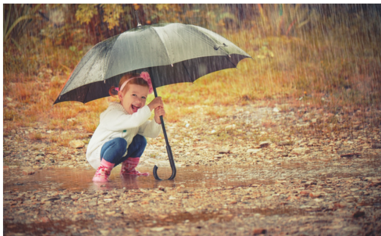
3. Voor onze kinderen want ook zij hebben recht op droge voeten en schoon water.

Goede communicatie draagt bij aan het waterbewustzijn. Mensen, bedrijven en overheden dienen bij het oplossen van knelpunten na te denken over water. Waterbewustzijn en samenwerking helpt bij het gezamenlijk oplossen van problemen met wateroverlast of uitdagingen voor waternatuur. In deze samenwerkingsverbanden bereik je pas echt meerwaarde als gemeenten, bedrijven, mensen én waterschap participeren.