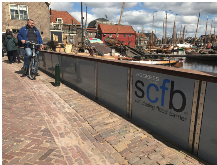
7. Nieuwe slimme hoogwaterbeschermingsconstructies voor waterveiligheid.

De AWP is een aanjager van deze ontwikkelingen. De AWP streeft daarbij steeds naar de hoogste toegevoegde waarde. Grondstoffen krijgen zo een hogere waarde dan biogas dat als energiedrager 'slechts' verbrand wordt. Deze ontwikkelingen gaan de AWP niet snel genoeg.