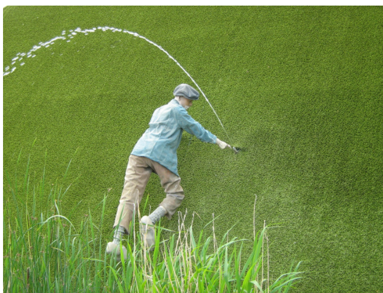
11. Een schuldenplafond van minder dan tweemaal de jaaropbrengsten is gezond.

De AWP eist daar waar dat van toepassing is een helder (kort) tijdpad om zo spoedig mogelijk onder de grens van maximaal tweeënhalf maal de jaaropbrengsten aan waterschapsbelastingen te komen. Een plafond van tweemaal de jaaropbrengsten of minder vindt de AWP gezond.