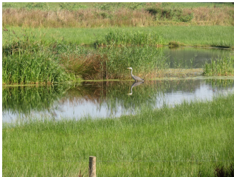
9. Schoon water leidt tot een mooiere waternatuur, met meer bloeiende planten langs de waterkant, een rijker insectenleven, en een betere visstand.

Inmiddels weten we dat grote en kleine gemalen onneembare barrières zijn voor vissen die willen passeren, denk bijvoorbeeld aan glasaal die vanuit zee de polders niet kunnen bereiken. De AWP wil dat de waterschappen een tijdsplan maken waarin aangegeven wordt hoe alle haarvaten van het watersysteem bereikbaar worden gemaakt voor vissen.