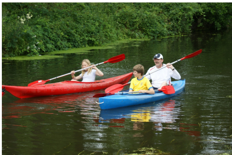
6. De AWP wil dat mensen kunnen genieten van water.

De AWP vindt dat de bewaking van zwemwater op blauwalg en botulisme goed geregeld dient te blijven. De zwemwater app voor mobiele telefoons en tablets is een goed voorbeeld van maatschappelijke meerwaarde die waterschappen relatief eenvoudig en tegen beperkte kosten bieden. Kleine moeite, groot plezier.