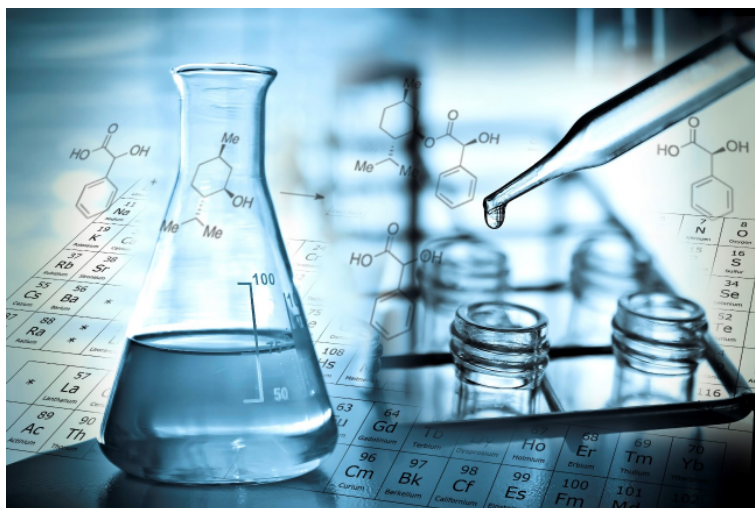
10. Medicijnresten en andere chemische stoffen kunnen zeer schadelijk zijn voor het milieu.

Onvermijdelijk moeten niet alleen aan de belangrijke bronnen maar ook op de rioolwaterzuiveringen maatregelen getroffen worden. Dat kost weliswaar tientallen euro's per inwoner per jaar, maar is door de integrale aanpak toch efficiënt en effectief.