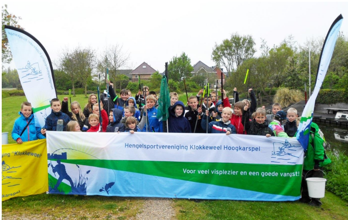
Spandoeken en beachflags versterken de uitstraling van de hengelsportvereniging.

Sportvisserij Nederland wil samen met de federaties de verenigingen op een praktische manier ondersteunen bij het verbeteren van de organisatie. Dat vereist een heldere visie op de kenmerken van een 'goede' hengelsportvereniging. We proberen hier zicht op te krijgen door informatie over alle verenigingen te verzamelen en daaruit af te leiden wat de succesfactoren zijn. Te denken valt aan samenwerking tussen verenigingen binnen een gemeente, goede contacten met hengelsportwinkels en de gemeente, voldoende bestuursleden en commissies die zich richten op bijvoorbeeld visstandbeheer, wedstrijden, jeugd en handhaving. Daarnaast blijven we bestuursleden ondersteunen met de cursus Beter besturen en vrijwilligers met opleidingen op verschillende terreinen. Verenigingsondersteuning is een primaire taak van de federaties, waar we ons echter gezamenlijk meer voor moeten inzetten. We stimuleren de federaties de verenigingen actiever te benaderen en te begeleiden bij het versterken van hun organisatie.